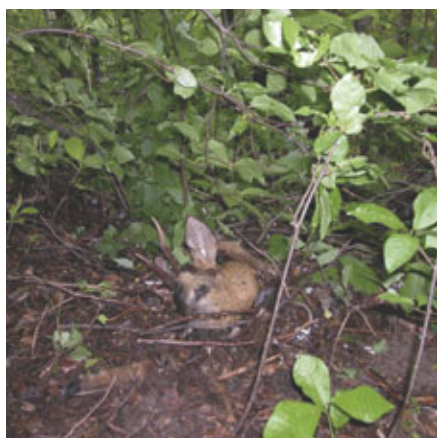
Photo 2. Small forest glades covered with natural regeneration or undergrowth play an important role regarding the lynx biology – they are foraging sites of their main prey – ungulates and make optimal conditions for localizing and stalking the potential prey

Fot 3. Resztki sarny zabitej przez rysia i ukrytej w gęstych zaroślach