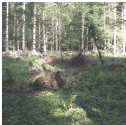
Photo 1. One of most important habitat characters determining the success of lynx' hunting was a degree of site complexity – presence of uprooted trees, fallen logs, lying branches and thickets

Fot. 2. Małe śródleśne polany porośnięte odnowieniem naturalnym bądź runem pełnią ważną rolę z uwagi na biologię rysia – stanowią miejsce żerowania ich głównych ofiar – ssaków kopytnych i stwarzają rysiom dogodne warunki do obserwacji i podchodzenia potencjalnych ofiar